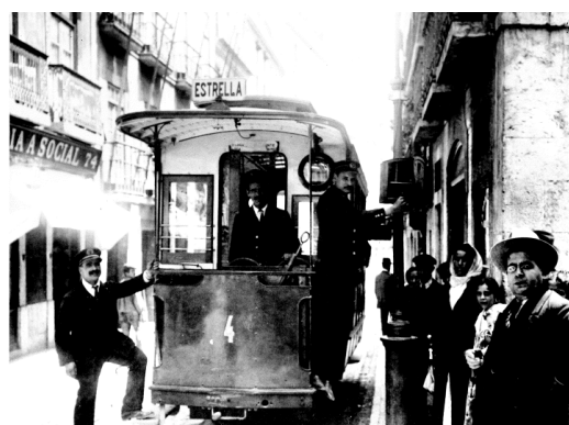
Fig. 1. Ascensor da Estrela, carro nº 4, início do séc. XX.

Em 1928, a carreira 28 tinha o primeiro prolongamento da Praça de Camões ao Rossio, com a designação de linha 28 Rossio-Estrela. Em 1936 chegava aos Prazeres, e em 1973 era prolongada até à Graça. Em 1984 ocorria o prolongamento da Graça ao Martim Moniz, ficando com o percurso Martim Moniz-Estrela/Prazeres (via Graça) que conhecemos hoje.