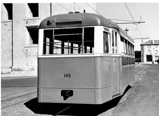
Fig. 1. Atrelado nº 101 em Belém junto à “raquete”, nos anos 50.

O Carro Atrelado nº 101 apresenta-se no museu, com o aspeto que tinha quando abatido ao serviço em 1991. No mês de março, o Atrelado nº 101 estará aberto para visita ao seu interior na Nave 2. A Nave 1, estará encerrada ao público, para trabalhos de melhoria no espaço expositivo. Durante este período, todos os bilhetes para visita ao Museu da Carris terão um desconto de 50 %.