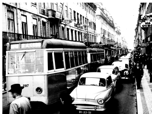
Fig. 3. Carro Elétrico nº297, com atrelado, a subir a Rua da Prata. Carro Elétrico nº297 com destino ao Arco do Cego, carreira nº 19, nos anos 60.