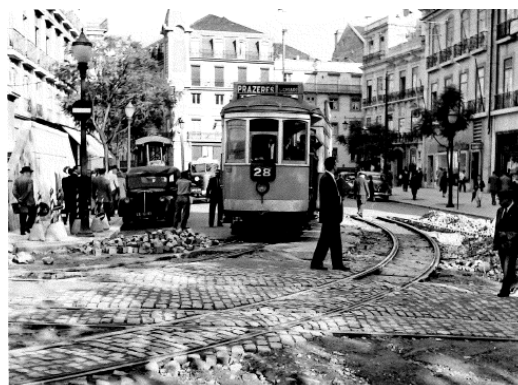
Fig. 2. Carro Elétrico nº 725 junto ao Largo de Camões durante trabalhos de assentamento de carris, data indeterminada.