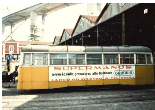
Fig. 4. Atrelado nº101 com painel Publicitário “Supermanos”, no Carban de Santo Amaro em 1984.